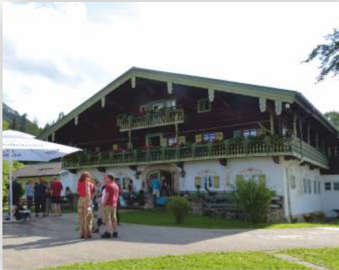
Labenbachhof bei Ruhpolding

Die Kosten für Unterkunft und Verpflegung liegen bei etwa 150 € bis 240 € pro Seminareinheit je nach Zimmerkategorie (Stand 2016).